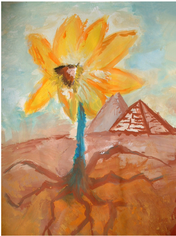
Polona Komatar, 9. b

Učence, ki so se v letošnjem šolskem letu najbolj izkazali (8. in 9. razred), smo izbrali glede na dosežke z različnih tekmovanj v znanju ali drugih aktivnostih. To so dosežki na šolskem (bronasta), regijskem (srebrna priznanja) ali državnem nivoju.