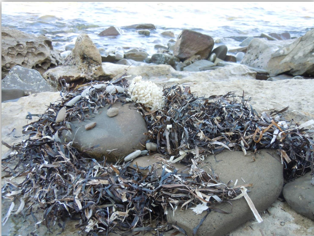
Nuša Štrajhar Morska deklica iz naravnih materialov