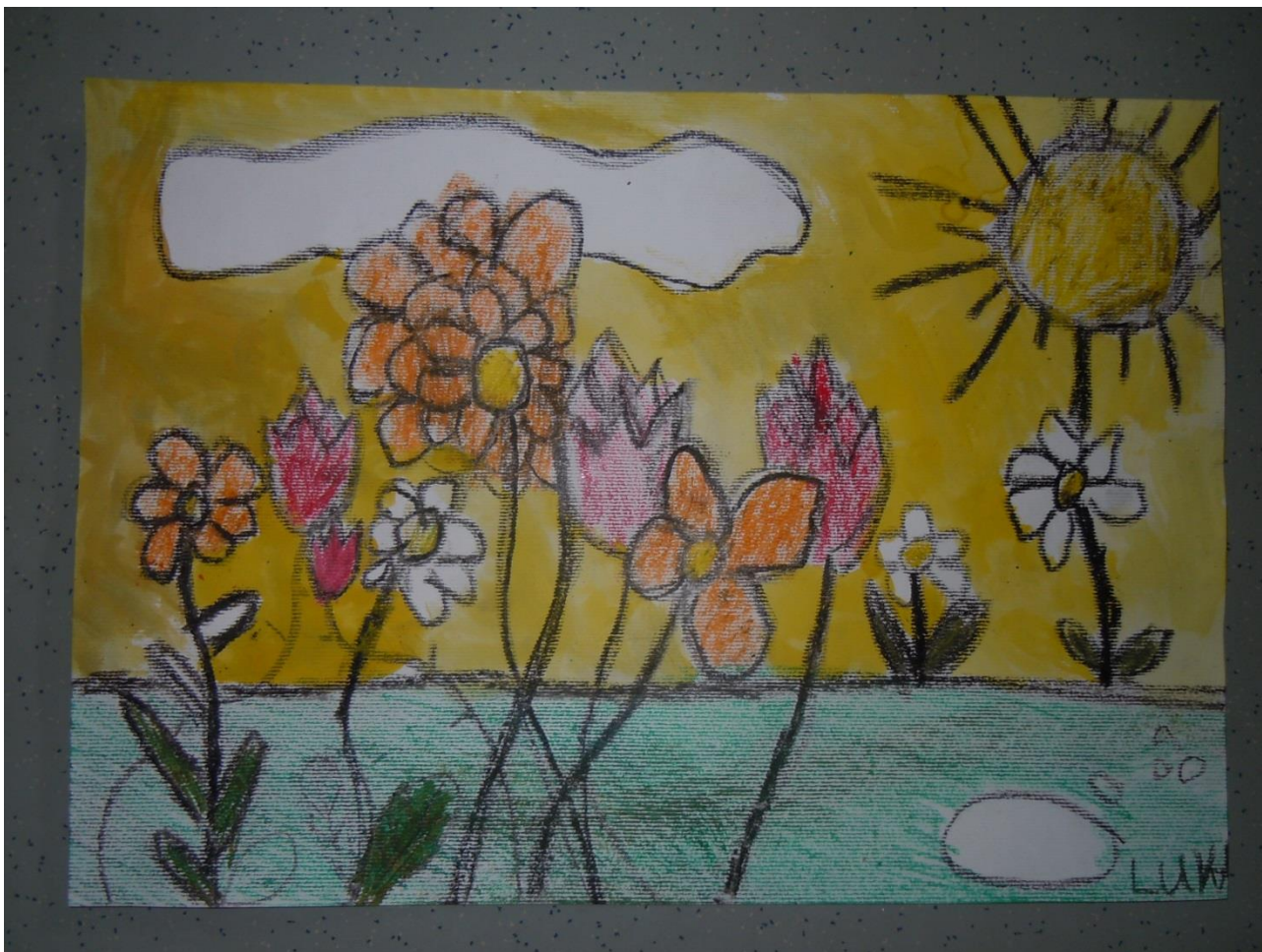
Luka Blažević Spomladansko cvetje