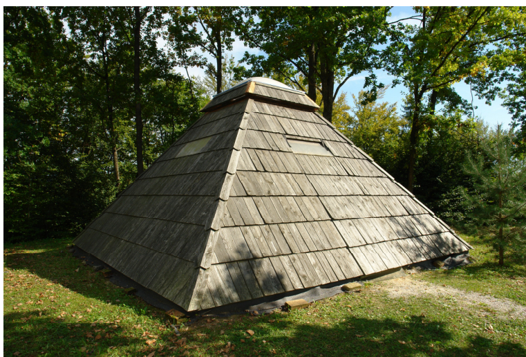
SLIKA 6: Energijska piramida

Energijska piramida je postavljena na najmočnejši energijski točki v Zdravilnem gaju, v njej pa je odsev vseh drugih energijskih centrov, torej so v njej zbrane vse energije, hkrati pa je tudi nasprotje točke v katero je oddana negativna energija. Zdravi rakasta obolenja, sladkorne bolezni, depresije in revmatološke težave. Piramida tudi poživlja telo.