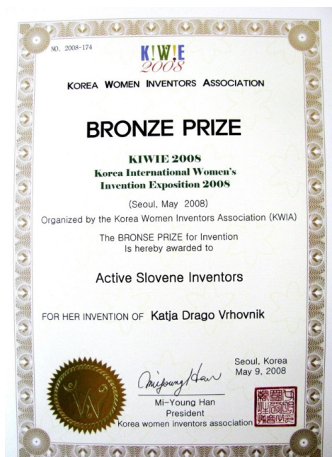
SLIKA 2: Bronasto priznanje iz Seoula

Živa voda v Tunjicah vsebuje 75 obstojnih elementov, le 9 manj kot jih ima človeško telo, prav tako pa je zaradi polzenja po silicijevih plasteh magnetizirana z Marijinimi energijami. Zaradi njenih značilnosti in uporabnosti bi lahko Živo vodo primerjali s tekočo hrano, saj bi lahko preživel tudi, če bi pili samo Živo vodo. Učinkovitost in lastnosti Žive vode so mednarodno znanstveno potrjeni s strani berlinskega inštituta. Opravljeno je bilo tudi več preizkusov o učinkovitosti vode z EPC tehnologijo in vsi so kazali izredno zdravilno učinkovitost vode iz Tunjic. Voda iz Tunjic torej lahko pomaga pri zdravljenju tako psihičnih, kot tudi fizičnih težav. Na mednarodnem inovacijskem sejmu v Seoulu je Živa voda iz Tunjic prejela bronasto priznanje.