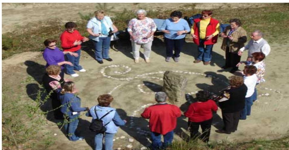
SLIKA 4: Terapija na energetskem centru