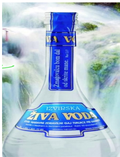
SLIKA 1: Živa voda iz Tunjic

Najprej moramo vedeti, da se živa voda močno razlikuje od vode v potokih in rekah, saj gre tu za posebno ledeniško vodo polno mineralov. Taka voda je do zdaj odkrita le na petih krajih, v vseh primerih pa so na mestu izvira ledeniki, ali pa so že skopneli. Vendar v Alpah zaradi apnenčaste kamninske sestave, žive vode ni, kajti območja izvirov žive vode so iz kremenca. Zaradi enake sestave, kot jo ima voda v živih bitjih, je ta voda dobila ime, Živa voda.