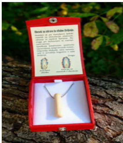
SLIKA 5: Obesek za zdravo in vitalno življenje

Zdravilno blato ugodno deluje predvsem na kožo, saj se ga lahko uporabi za obloge in lepotne maske. Energijski kamni imajo pomirjajočo blažilno moč in pomagajo predvsem pri mentalnem in duhovnem življenju. Obesek za zdravo in vitalno življenje vsebuje to energijo in dokazano pomaga pri omenjenih težavah.